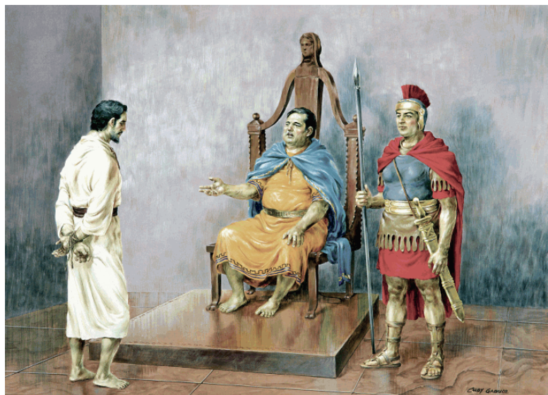
Show #85: Jesus tried and condemned by Pilate

彼拉多听到犹太宗教领袖控告耶稣，就审问耶稣说：“你是犹太人的王吗？”耶稣回答说：“你说的是。”然后祭司长愤怒的提出了许多的假见证指控耶稣。彼拉多继续地问