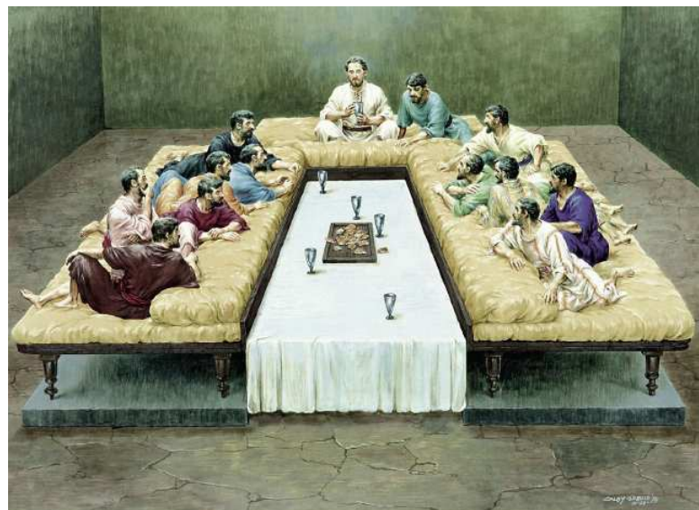
Show #82: Jesus last supper with his disciples