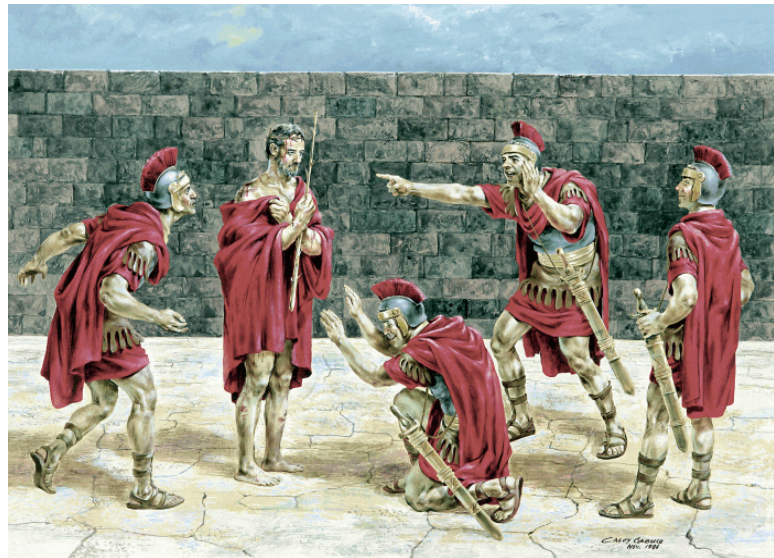
Show #86: The Roman soldiers torture and mock Jesus

耶稣，还讥笑祂，他们用鞭子鞭打耶稣，使耶稣满身是伤，承受极大的痛苦。兵丁给耶稣穿上王所穿的紫袍来嘲笑祂，又用荆棘编作冠冕，戴在祂的头上戏弄祂，这