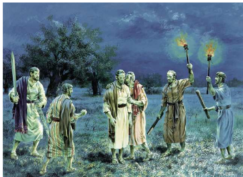
Show #84: Judas betrayed Jesus

耶稣祷告结束后，准备和门徒一起离开。说话之间，那十二门徒里的犹大来了，并有许多人带着刀棒，从祭司长和民间的长老那里与他同来，要将耶稣带