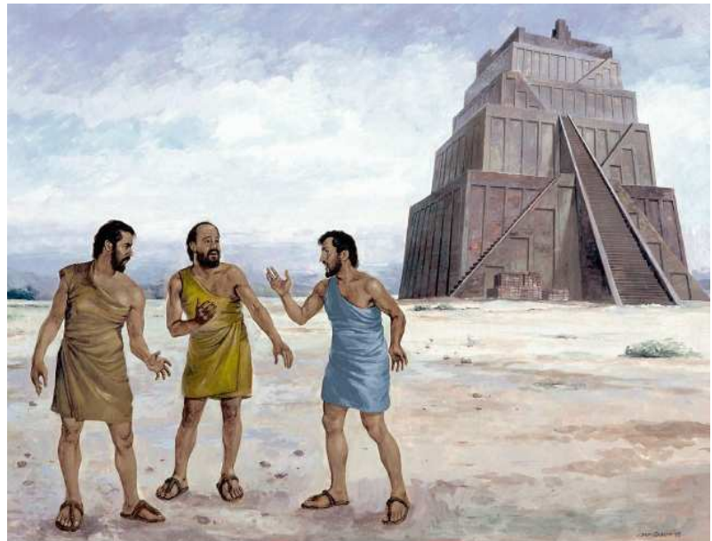
Show #12: God confused the languages at the Tower of Babel

同谋划策也成了不可能的事情，他们再也听不懂同伴所表达的意思，混乱的场面使他们必须停下手中的工作。那时神的审判临到他们。