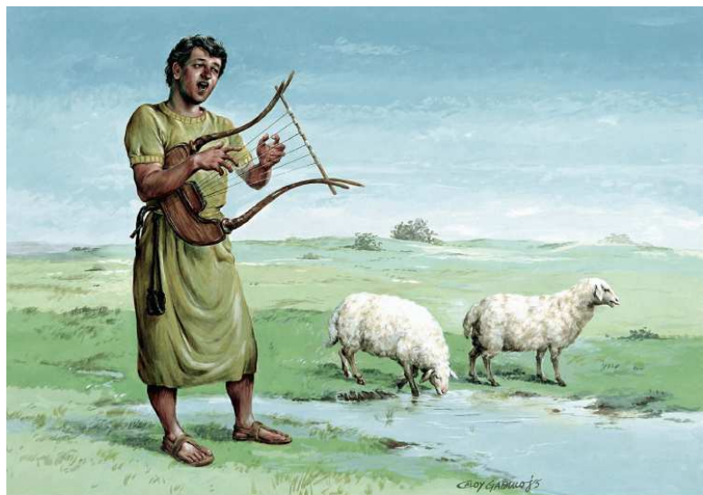
Show #42: David the shepherd

大卫和我们一样，都是罪人，需要从罪的刑罚中得蒙救赎。他知道自己是个罪人，而且没有自救的指望，这就是他为什么依靠神的原因。他信靠神，向神献上带血的祭物，以此表示他是该死的；他也相信神会悦纳血祭所代表的赎价。大卫拥有与亚伯、挪亚、亚伯拉罕、以撒、雅各，还有其他一些人