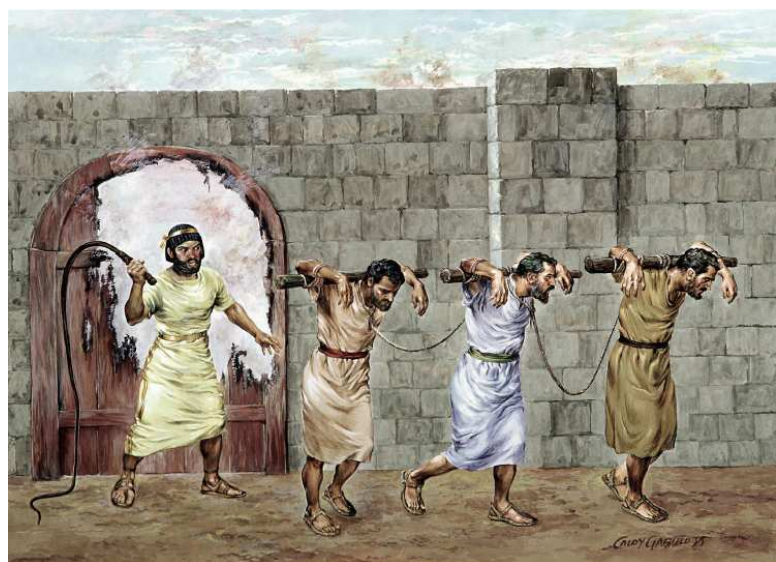
Show #47: The Israelites taken into captivity