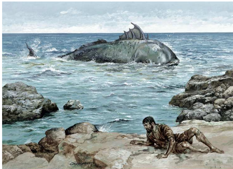
Show #45: Jonah and the huge fish

约拿在鱼腹中三日三夜，是神存留他的性命，让他依然活着。因此，约拿有足够的时间去思想自己的不顺服，所以他大声