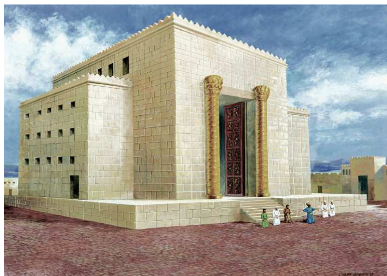
Show #43: Solomon's temple

祭司们在圣殿里，就像在会幕里一样，继续履行着各自的职务。在一年一次的赎罪日，大祭司要带着祭牲的血进入至圣所，把它弹在施恩座上。如果每一步都按照神的旨意行，神就会赦免百姓上一年的罪。在圣殿里，亲近