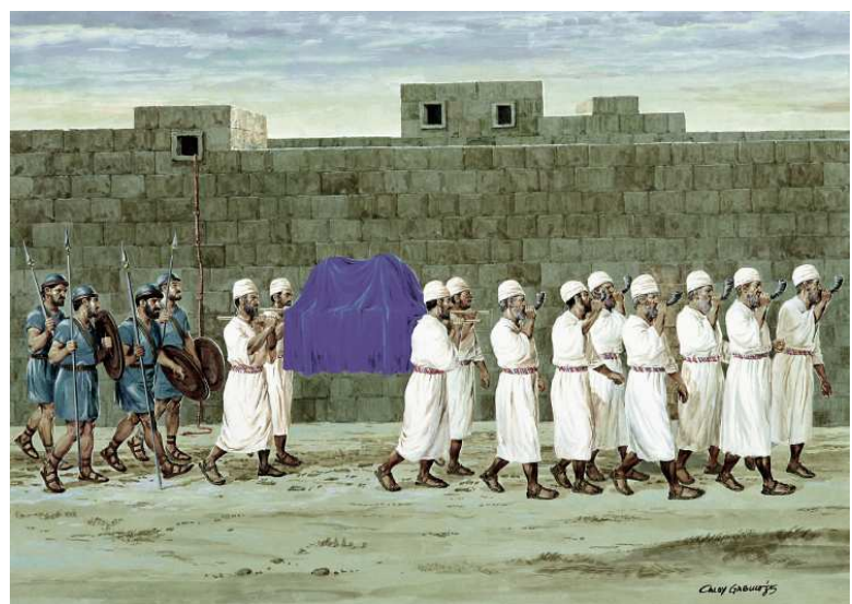
Show # 39: The Israelites march around Jericho

之后，摩西登上尼波山，上了毗斯迦山顶。在那里，神将迦南全地指给他看，并对他说，这就是我向亚拍拉罕、以撒、雅各起誓所应许之地，现在我使你眼睛看见了，你却不得过到那里去。于是，耶和华的仆人摩西就死在摩押地。耶和华将他葬在摩押地，伯