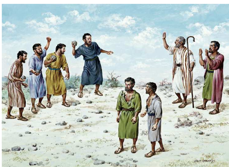
Show #38: Angry Israelites ready to stone Moses and Aaron