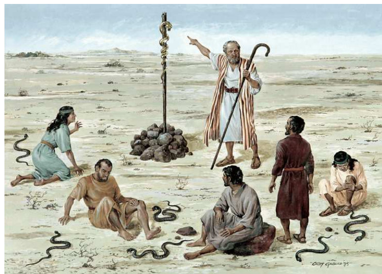
Show #37: The bronze serpent

随后，神的审判临到了他们，火蛇便进入他们中间咬他们，因多人痛苦至极而死亡。于是，百姓到摩西那里，承认他们的罪，祈求神的怜悯，然后神吩咐摩西