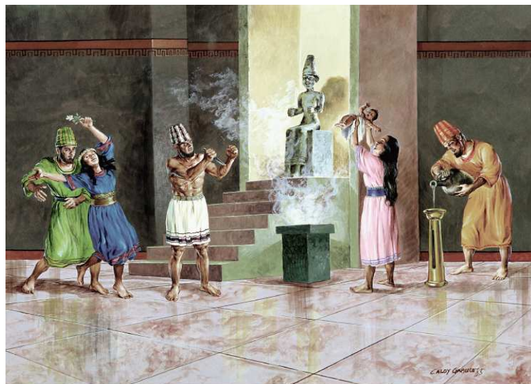
Show #40: The Israelites worshiped idols

尽管约书亚带领以色列民占领了迦南地，但仍有一些崇拜偶像的迦南人遍及那地。这些迦南人以敬拜假神来取代了对真神的敬拜。他们称自己所拜的