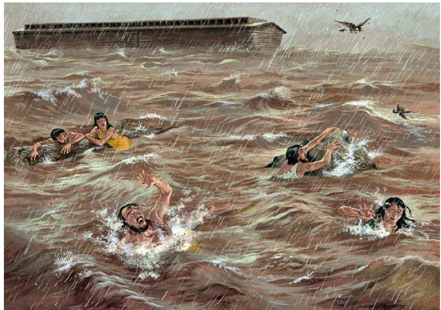
Show #10: The Great Flood

于是，神就降雨在地上。所有方舟之外的罪人开始恐慌失措，恳求挪亚怜悯他们，“挪亚，挪亚，请把门打开！求你怜悯我们吧！”但现在已经太迟了。他们就这样被拒在方舟之外，而水位也在继续上涨。那些嘲笑挪亚和拒绝神的罪人，神不能再拯救他们了。神将方舟的门关闭，这就意味着他们将永远被拒绝于方舟之外。而挪亚和他的家人及所有的动物，都被神安全地关在方舟里。这是有史以来的第一场雨，然后洪水开始淹没大地，方舟之外的人也开始狂呼嚎叫。在人们试图爬到高处躲避上涨的洪水时，那里呈现出一片混乱的景象。他们跑到高山上，但洪水却一直上涨，最终他们都被洪水淹没了。任何一个在方舟之外的人都没有躲过神的审判，他们全部在这场洪水中灭亡了。